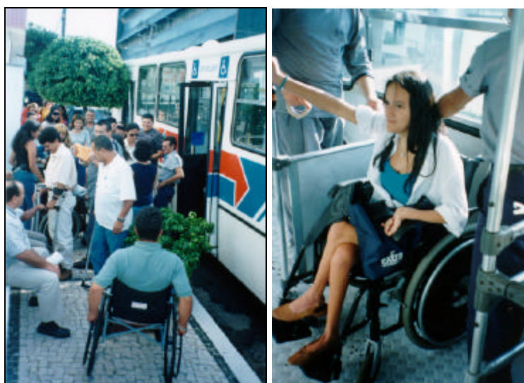
Figura 2: Embarque de alunos em ônibus com elevador eletro-hidráulico para vivência em aula prática e interior de ônibus com elevador – local destinado à cadeirantes.