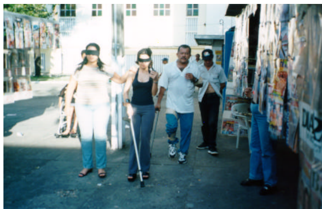
Figura 5: Praça Coração de Jesus – Vivência: deficientes visuais.