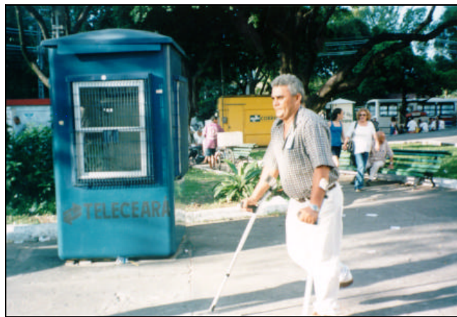
Figura 4: Aula prática na Praça Coração de Jesus (centro de Fortaleza). Aluno de muletas.