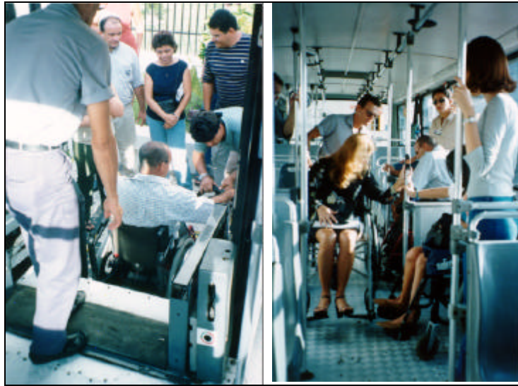
Figura 3: Treinamento de operadores na locomoção e desembarque de aluno.