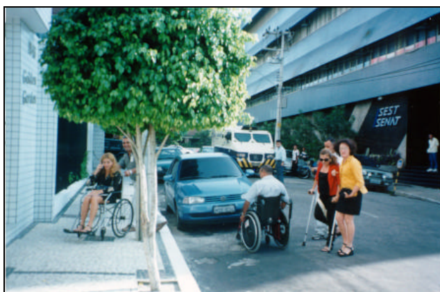
Figura 1:Aula prática para sentir as dificuldades encontradas pelas PPD's